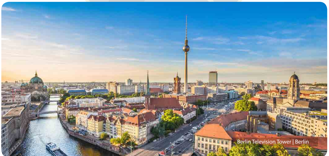
Berlin Television Tower | Berlin

کشورهای آلمان، کانادا و دیگر کشورهای اروپایی و کشورهای پیشرفته در زمینه های کاریابی، کارآفرینی، سرمایه گذاری و... می باشد. ما در تمامی مراحل شامل اقدامات قانونی، حقوقی و رسمی، ارتباط با کارفرما یا شرکای کاری، اسکان و جابجایی و تمامی اقدامات دیگر تا حصول نتیجه شما را همراهی میکنیم.